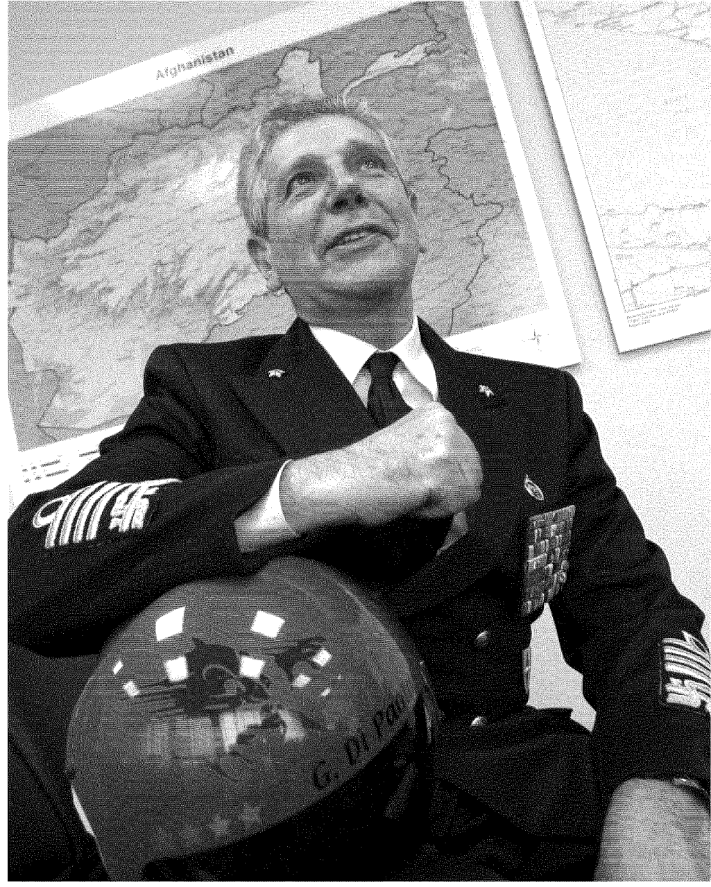
Il ministro della Difesa Giampaolo Di Paola